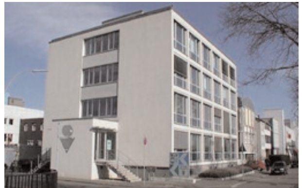
Gebäude der SLV Fellbach mit Geschäftsstelle Fördergemeinschaft

Die Fördergemeinschaft seit 1971 eine Erfolgsgeschichte