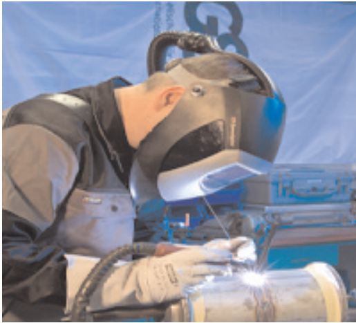
Standardschweißprozess WIG am CrNi-Rohr mit Formieren

Die anwendungsorientierte Versuchstätigkeit und Industrieforschung bei neuen Technologien erstreckt sich auch auf das Widerstandsschweißen, das vollmechanisierte Lichtbogenschweißen mit Industrieroboter und die Lasermaterialbearbeitung.