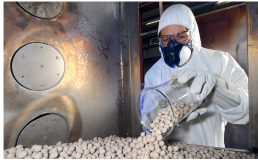
Keramik-Materialien im Test als Wärmespeicher

mit Wärmespeichern nachzurüsten und zu einem späteren Zeitpunkt kleinere Anlagen, deren Nachrüstung und Einbindung ins System deutlich komplizierter und kostenintensiver ist. Davon unbenommen sollte die Fortführung der Wärmespeicherförderung mittels Investitionszuschüssen sichergestellt werden.