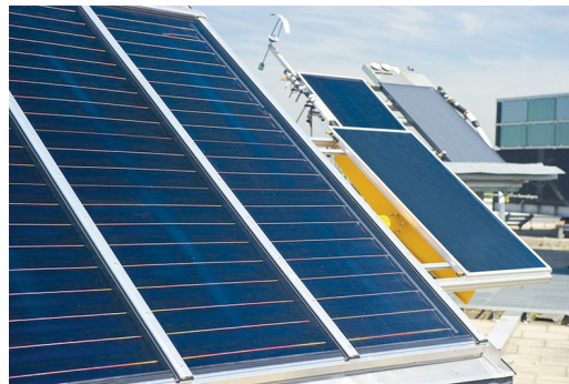
Außenteststand des TestLab Solar Thermal Systems des © Fraunhofer ISE