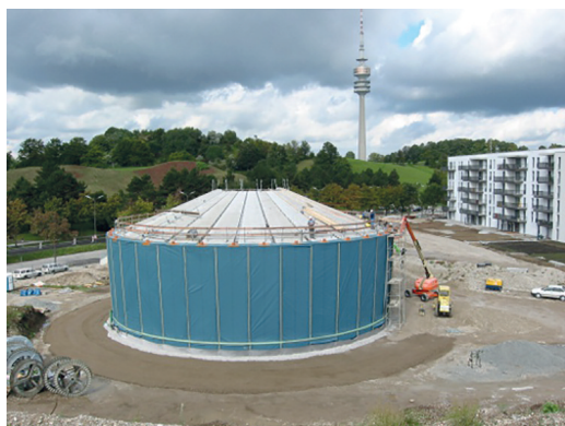
Bau eines saisonalen Wärmespeichers für ein solares Nahwärmenetz

Der betriebswirtschaftliche „Wert“ einer mittels Wärmespeicher flexibilisierten KWK-Anlage liegt darin begründet, dass der Anlagenbetreiber unabhängig